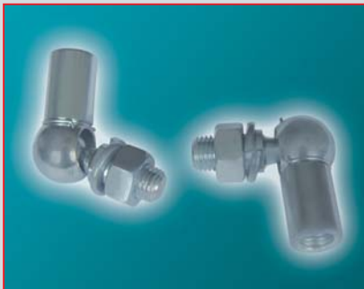
Kugelgelenk für N 1-4A (NL) ball joint for N 1-4A (NL) articulation sphérique pour N 1-4A (NL)