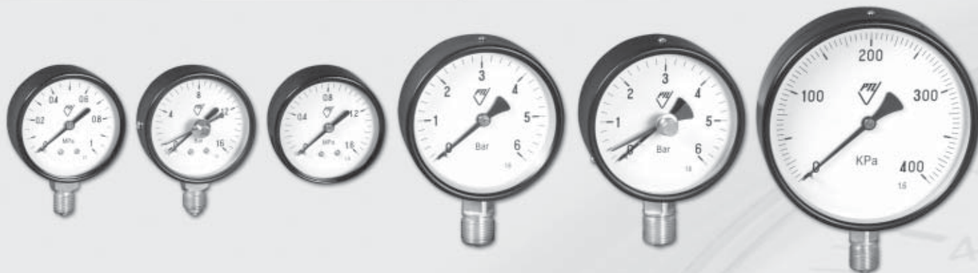
03 304 - AZ