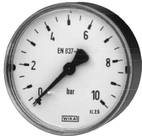
tlakoměr s pružnou trubicí typ 111.12